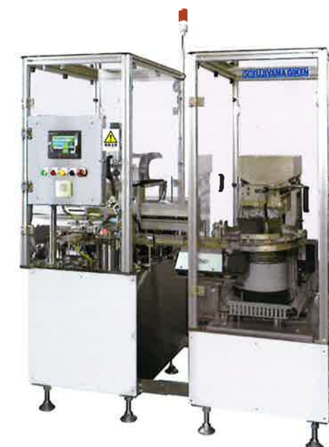
製品供給ロボットシステム

能力 製品仕様により異なります。対応容器 シリンジ・ニードル・カテーテル・医療器具・綿・他