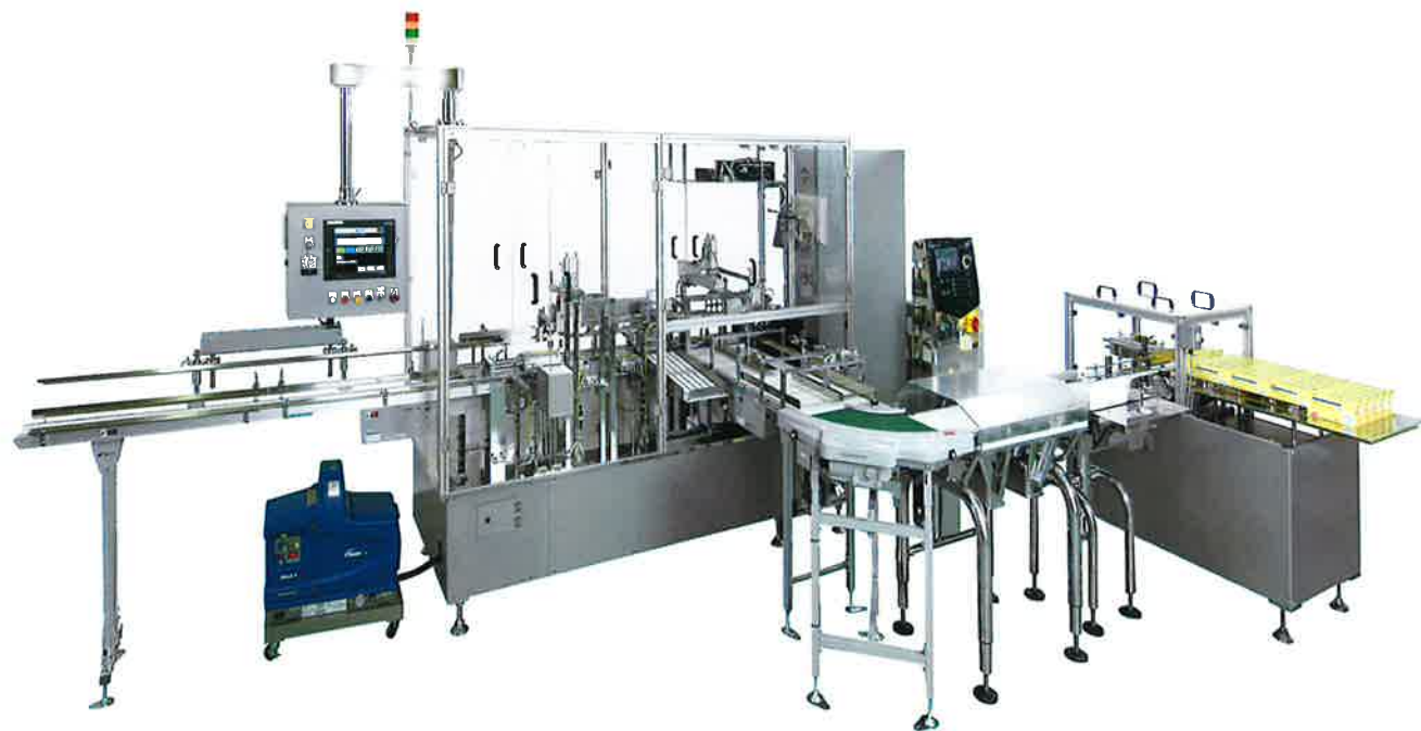
各種印字装置搭載可能