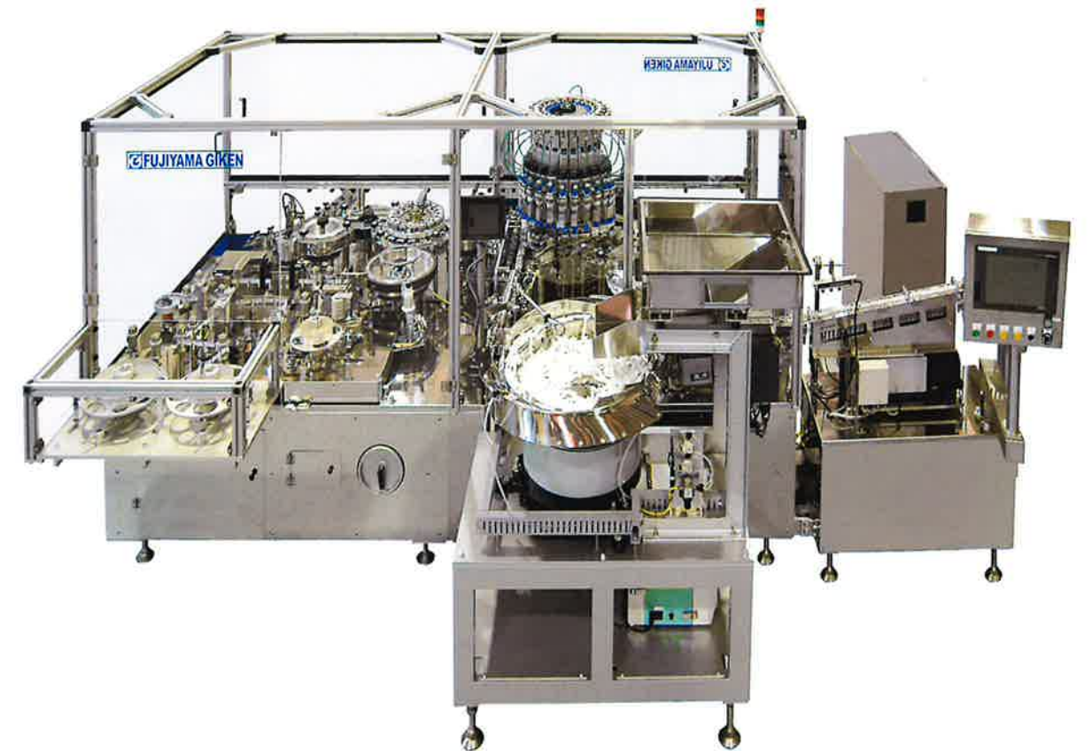
ラベル貼付け機構

能力 【~300本/分】*製品仕様により異なります。対応容器 プレフィルドシリンジ・ディスボシリンジ