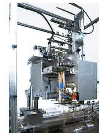
最短距離での装着