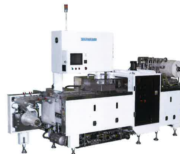
シート加熱成形部