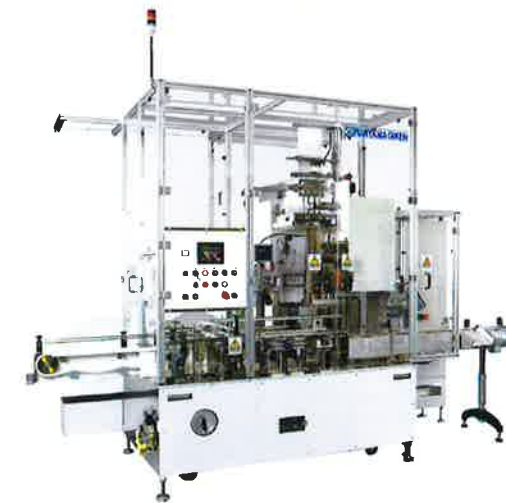
製品搬送部（チャック式）

能力 【80本/分】※製品仕様により異なります。対応容器 丸・角・扁平各種対応可能