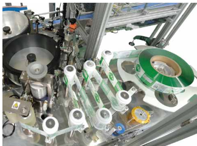
ロールフィルムタイプ