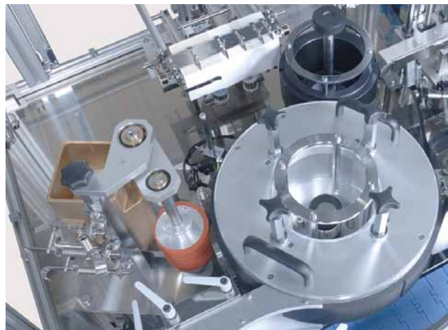
コールドグルータイプ