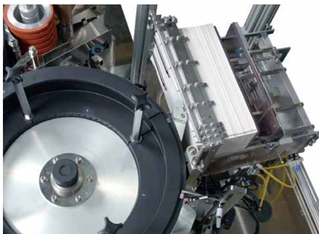
枚葉ラベルタイプ