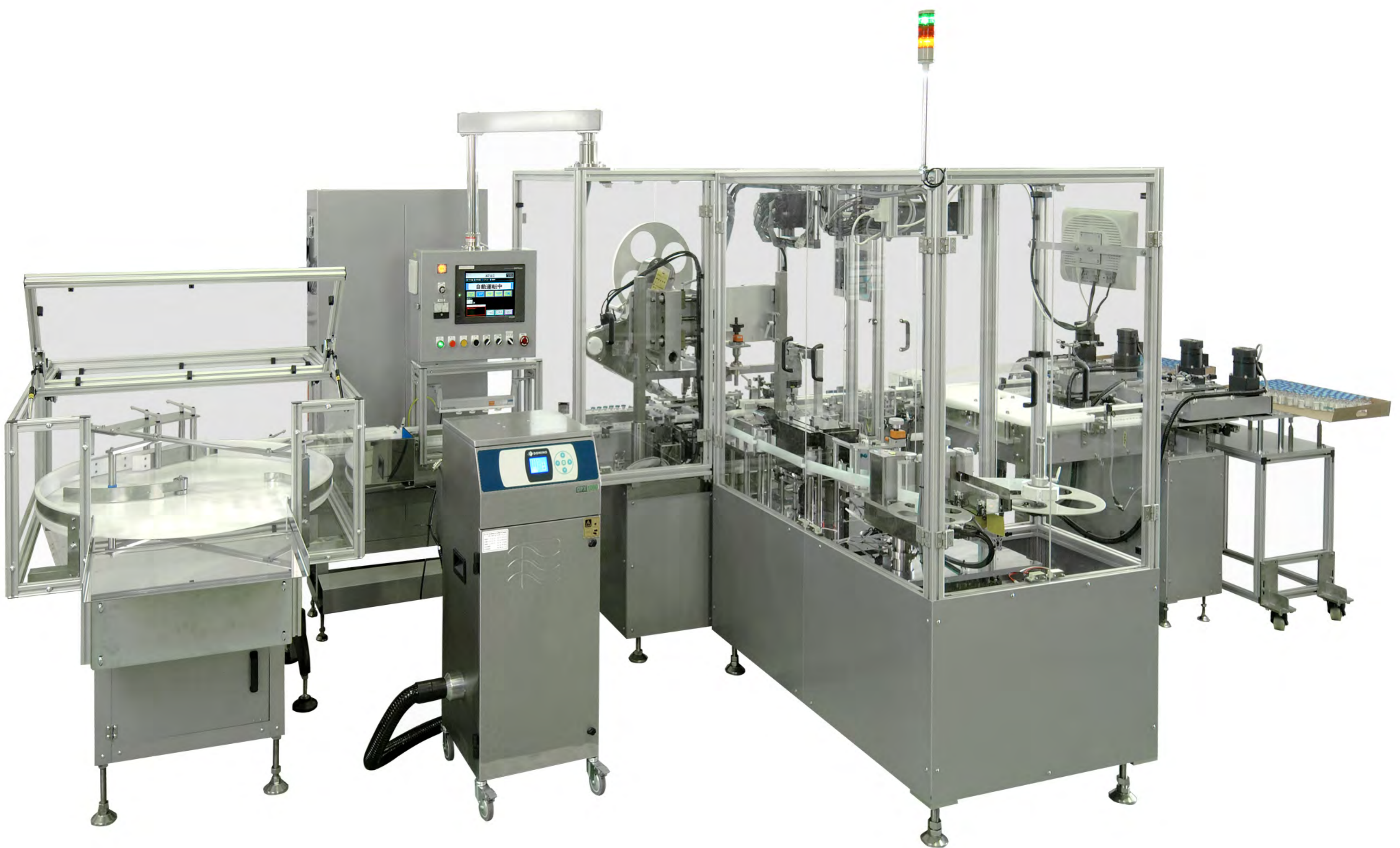
ラベル貼付機構 (天面、胴)

能力 【～110本／分】※製品仕様により異なります。 対応容器 バイアル・丸容器など