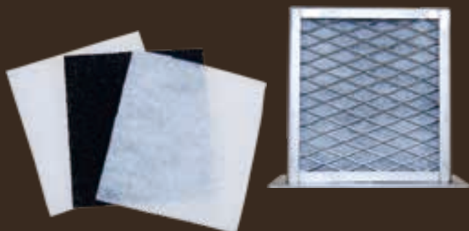
フィルターの交換